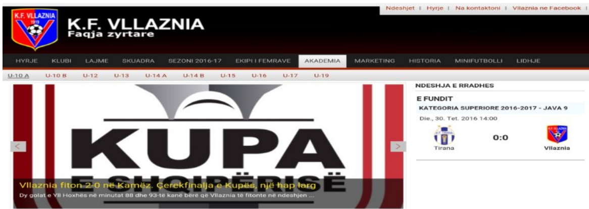
Fig.2 Faqja zyrtare e shoqërisë “KLUBI I FUTBOLLIT VLLAZNIA” sh.a.

Koment: Nga informacionet e grumbulluara Shoqëria “KLUBI I FUTBOLLIT VLLAZNIA” sh.a. si një shoqëri publike me kapital 100% të Bashkisë Shkodër e rregjistruar si person juridik më vehte është e detyruar të zbatojë dispozitat e nenit 4 të ligjit Nr. 119/2014, “Për të drejtën e informimit” duke miratuar programin e transparencës si dhe duke e publikuar atë në faqen zyrtare të shoqërisë www.vllaznia.al nuk e ka publikuar atë në faqen zyrtare të shoqërisë.