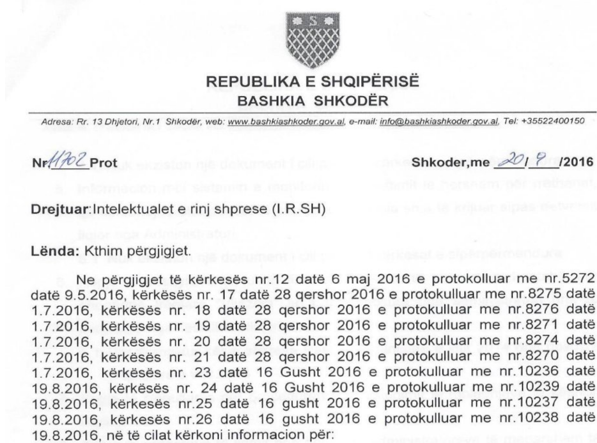
Fig.1. Përgjigje e Bashkisë Shkodër nr.11702, datë 20/9/2016 ndaj kërkesave për informacion

Koment: Sic u përmend edhe mësipër gjatë hartimit të këtij raporti janë ndeshur vështirësi në grumbullimin e informacionit zyrtarë. Mungesa e respektimit të detyrimeve ligjore nga ana e drejtuesve lokalë përbën një problematikë më vehte në përgjithësi. Synimi ka qënë që raporti të hartohet në formën e një bashkpunimi për të kontribuar në korrigjimin e atyre gabimeve që mund të konstatoheshin nga analizimi i të dhënave. Duke parë një lloj mefshtësie nga ana e drejtuesve vendorë ku informacioni i kërkuar nga katër shkresat e dërguara mungonte vendosëm ti ridërgonim këto kërkesa me shpresën që informacioni i kërkuar do të dërgohej. Në kushtet kur edhe kërkesat e ripërsëritura nuk morën asnjë përgjigje atëherë ju drejtuam Komisionerit për të Drejtën e Informimit dhe Mbrojtjes së të Dhënave Personale. Menjëherë pas ankimit pranë Komisionerit për të Drejtën e Informimit dhe Mbrojtjen e të Dhënave Personale u bë e mundur të merret informacioni i kërkuar!