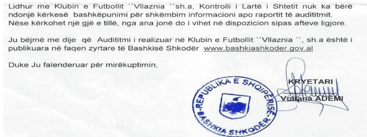
Fig 7 Përgjigje e Bashkisë Nr.Prot 11584/1 datë 30/09/2016

Koment: Ligji nr.114/2015, “Për auditimin e Brendshëm në sektorin publik” në nenin 25 të tij i detyron autoritetet publike të shkëmbejnë informacion me Kontrollin e Lartë të Shtetit për shmangien e mbivendosjeve në lidhje me planet e auditimit si dhe raportet e auditimit duke përcaktuar se: